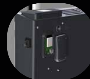
RADIALIGHT WiFi MODULE Codice Ean 8019250955116

Trovate tutte le istruzioni sul sito radialight.com