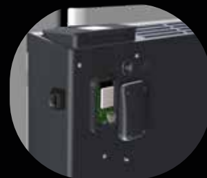
RADIALIGHT WiFi MODULE Codice Ean 8019250955116

Trovate tutte le istruzioni sul sito radialight.com